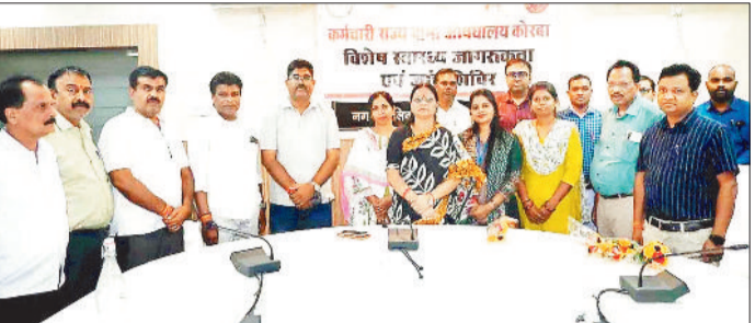
शिविर के समापन समारोह में शामिल महापौर व अन्य।