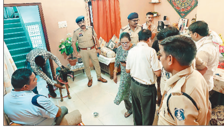
घटना स्थल पर जांच करती पुलिस।

निगम के मुताबिक इन दुकानों से हर महीने 8 लाख 20 हजार और सालाना करीब एक करोड़ रुपए का किराया मिलेगा। शेष दुकानों के आबंटन के लिए कुछ दिनों बाद प्रक्रिया होगी।