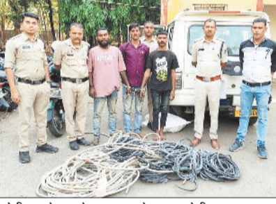
चोरी गए केबल के साथ पकड़े गए आरोपी।