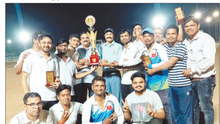
ट्राफी के साथ विजेता टीम के खिलाड़ी।