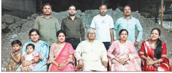
जयंती कार्यक्रम में शामिल समाज के लोग।